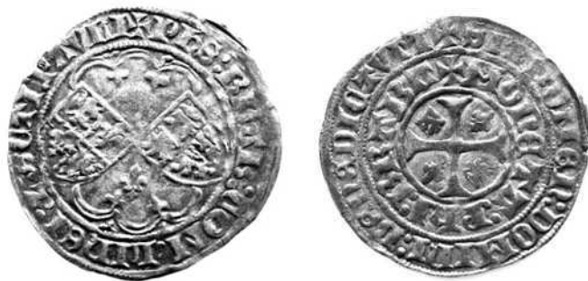
(Schaal 1,5: 1)