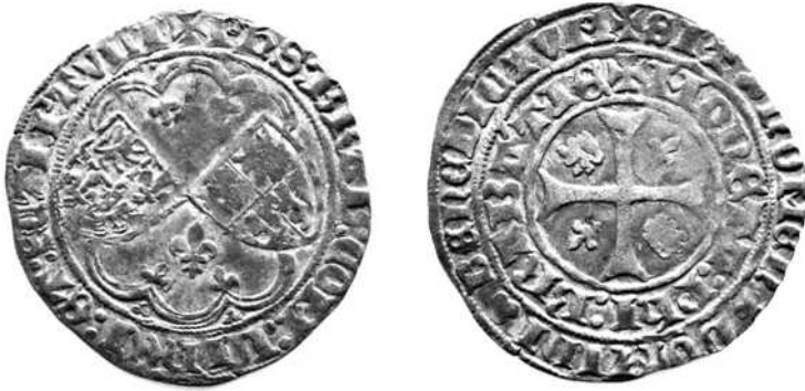
(Schaal 1,5: 1)

De drielanders en zijn onderverdelingen worden hierna in detail beschreven 17/ .