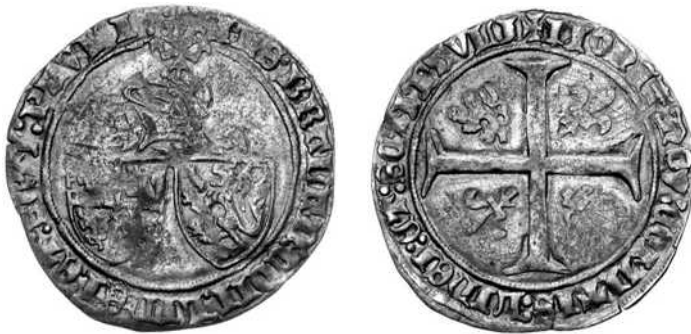
(Schaal 1,5: 1)

Behalve de drie bovenvermelde stukken, waarvan met zekerheid mag worden gesteld dat ze in Walem werden geslagen, zijn er nog enkele andere munten gekend van Filips van Saint-Pol, waarbij numismaten het oneens zijn over de plaats van aanmuntung: