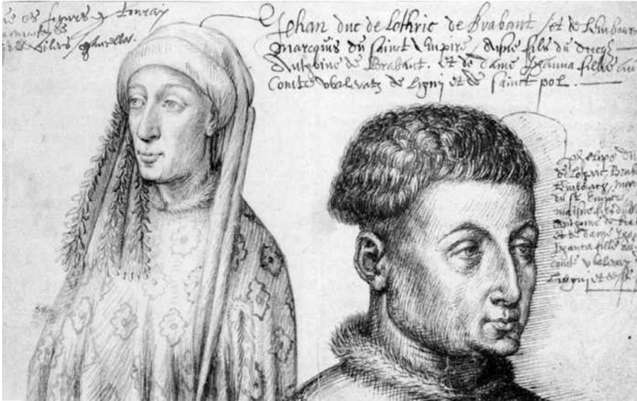
Jan IV en zijn jongere broer Philips van Saint-Pol Afbeelding door Antonio de Succa [18]

Henegouwen ging naar een telg uit het huis van Luxemburg en Holland-Zeeland ging naar naar Filips van Bourgondië, graaf van Vlaanderen.