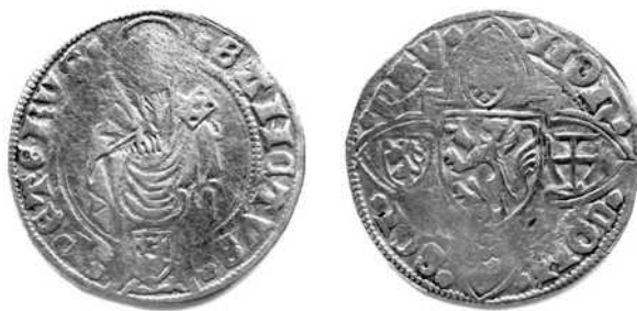
(Schaal 1,5: 1)

Een (enkelvoudige) groot van Filips van Saint-Pol van hetzelfde type kwam voor in de muntvondst van Amsterdam van 1918 [11], die tevens één exemplaar van deze dubbele groot bevatte. Vandaag is deze groot nog steeds het enige mij bekende exemplaar.