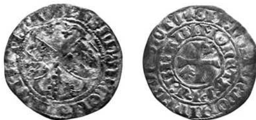
(Schaal 1,5: 1)